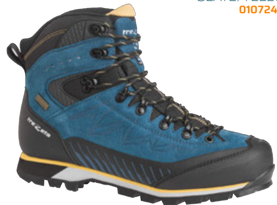
TORNADO WP SLATE/YELLOW 010724240