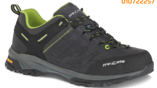
RAIDER WP DARK GREY-LIME 010722257