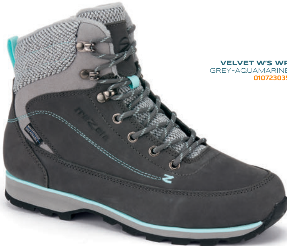
VELVET W'S WP GREY-AQUAMARINE 010723035

Velvet W'S WP è una scarpa dal taglio mid di Trezeta, progettata e realizzata per calzare alla perfezione il piede femminile, rispettarne l'anatomia e accompagnarti nelle tue passeggiate invernali in città o in mezzo alla natura.