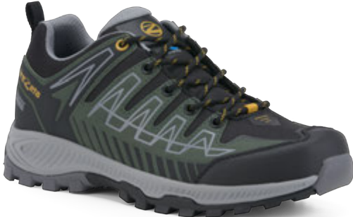
THUNDER WP DARK GREEN-YELLOW 010724095