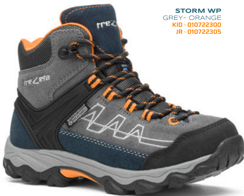
STORM WP GREY- ORANGE KID · 010722300 JR · 010722305

Storm è lo scarponcino da trekking di Trezeta creato per i piccoli esploratori che amano trascorrere il tempo libero all'aria aperta sentendosi comodi e sicuri.