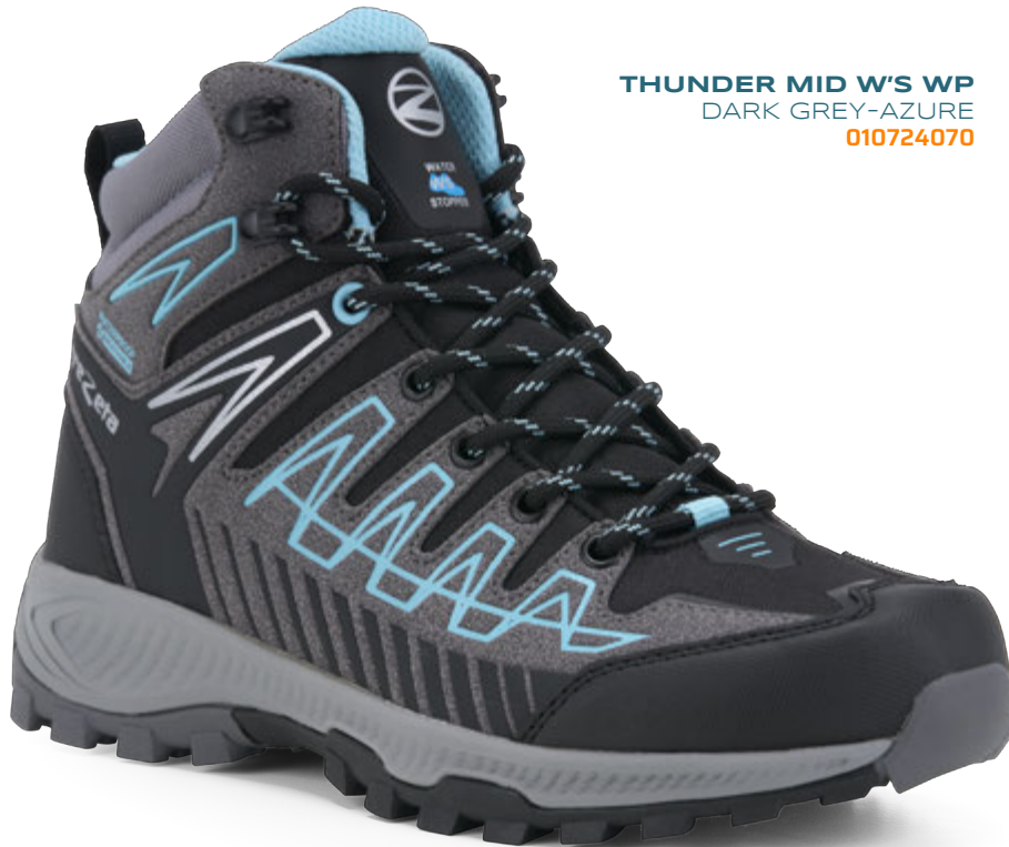
THUNDER MID W'S WP DARK GREY-AZURE 010724070