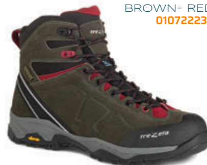
DRIFT WP BROWN- RED 010722235