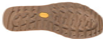
Vibram® Predator II