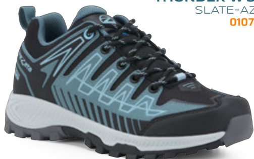
THUNDER W'S WP SLATE-AZURE 010724110