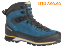
TORNADO WP SLATE/YELLOW 010724240