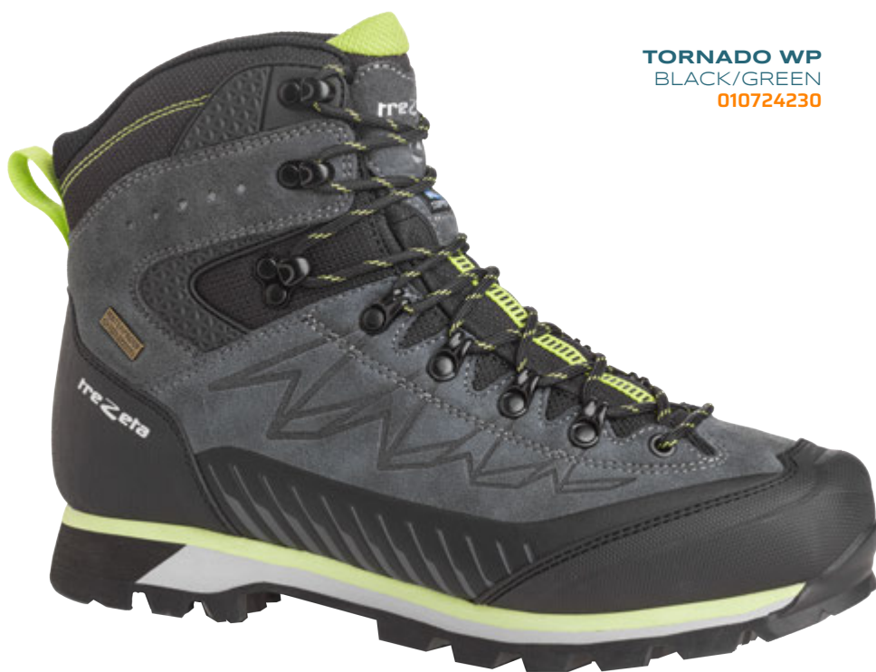
TORNADO WP BLACK/GREEN 010724230

IT/ TORNADO WP di Trezeta è una scarpa versatile di taglio medio, ideale per il trekking, le escursioni impegnative e le vie ferrate. Progettato per affrontare sentieri tecnici e molti altri tipi di percorsi.