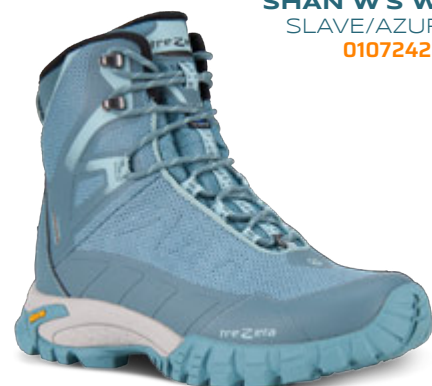
SHAN W'S WP SLAVE/AZURE 010724205