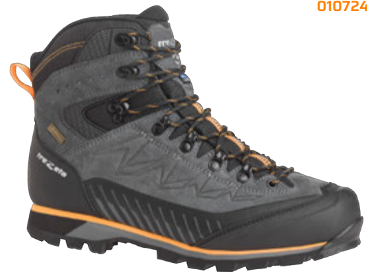
TORNADO WP GREY/ORANGE 010724235