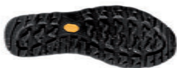
Vibram® Predator II