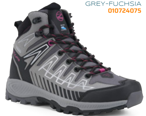
THUNDER MID W'S WP GREY-FUCHSIA 010724075