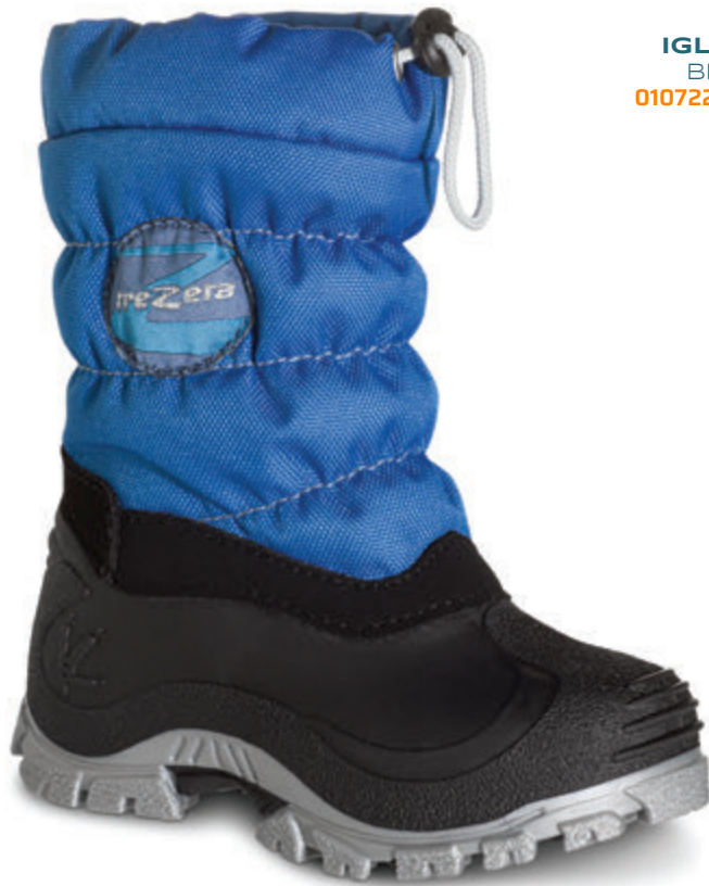
IGLOO BLUE 010722520

No a piedi freddi e bagnati! Igloo è un doposci caldo e comodo perfetto per giocare sulla neve senza preoccuparsi di freddo e infiltrazioni d'acqua.