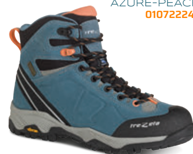
DRIFT W'S WP AZURE-PEACH 010722245