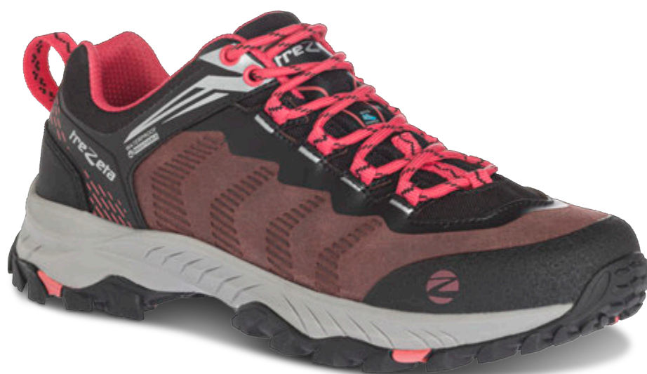
HYPE W'S WP PRUNE-ROSE 010722750