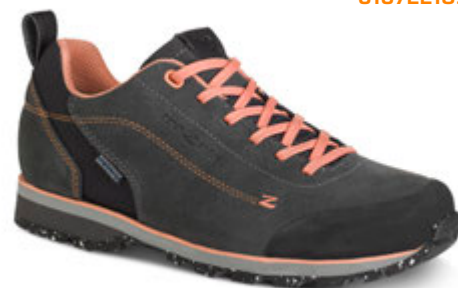
ZETA W'S WP DARK GREY-PEACH 010722185