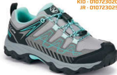
THUNDER WP GREY-GREEN KID · 010723020 JR · 010723025