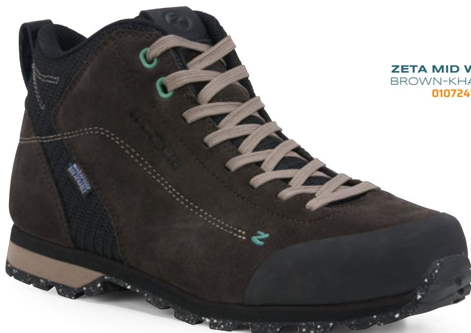
ZETA MID WP BROWN-KHAKI 010724155

Mood cittadino o spirito da travel blogger? Vai ovunque senza pensieri! Zeta Mid WP è ideale per proteggere la caviglia ma anche per chi ama uno stile attuale.