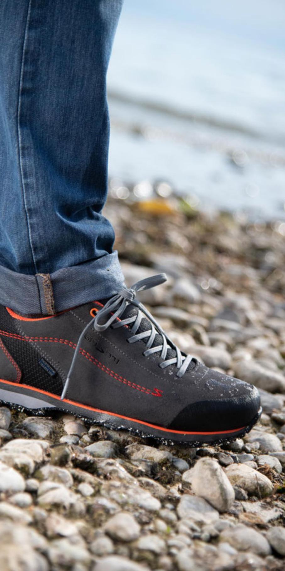
ZETA WP GREY-ORANGE 010722610