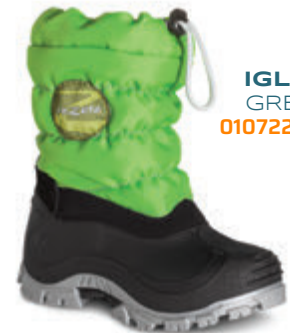
IGLOO GREEN 010722530