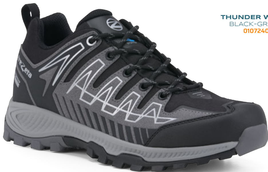
THUNDER WP BLACK-GREY 010724085

Presentiamo la Thunder WP, una nuova scarpa dal design accattivante e aggressivo. Questa calzatura innovativa si distingue come la più leggera nella sua categoria, vantando un rivoluzionario blocco suola che privilegia sia il comfort che la versatilità. Si rivela il compagno ideale per una vasta gamma di attività.