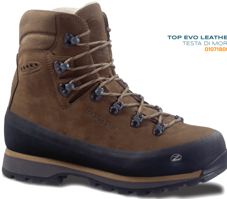
TOP EVO LEATHER TESTA DI MORO 010718002

Calzatura ideale per attività di backpacking con carichi di portata da media a importante ed offre eccellente stabilità su tutti i terreni di montagna e su superfici bagnate.