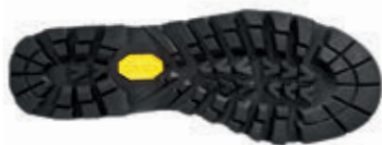
Vibram® Winkler Evo