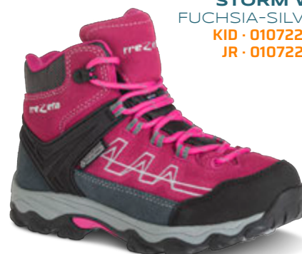
STORM WP FUCHSIA-SILVER KID · 010722310 JR · 010722315