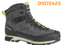
TORNADO WP BLACK/GREEN 010724230