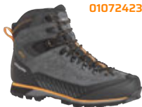
TORNADO WP GREY/ORANGE 010724235