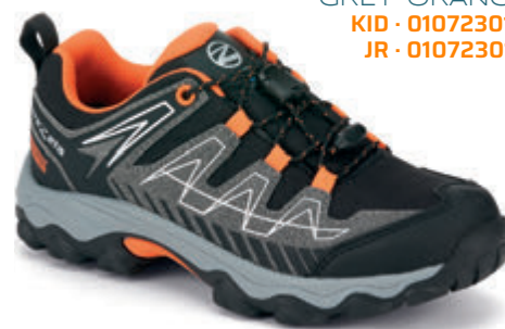
THUNDER WP GREY-ORANGE KID · 010723010 JR · 010723015