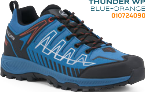
THUNDER WP BLUE-ORANGE 010724090