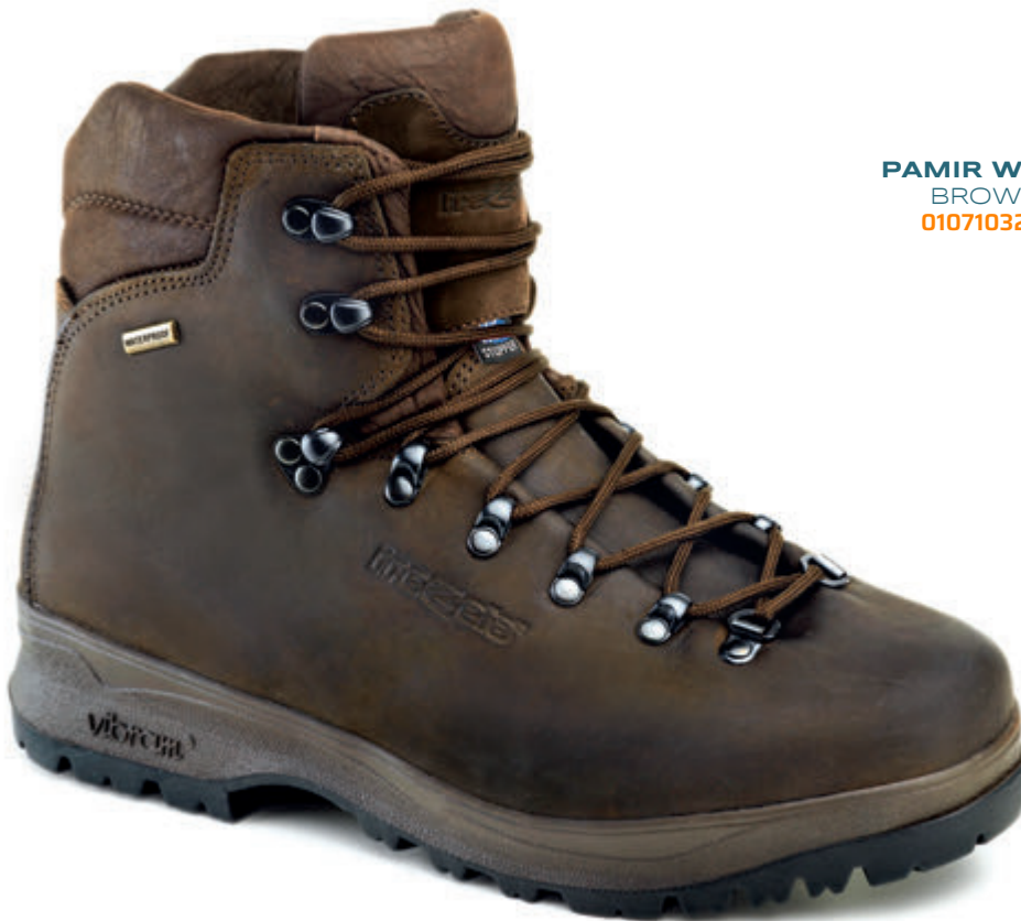
PAMIR WP BROWN 010710320

Adatto in generale all'attività di trekking di media montagna come a numerose attività lavorative in ambiente montano o rurale. Impermeabile e traspirante, costruito con tomaia in nubuck a pezzo unico ed esclusiva suola Vibram® Rothorn.