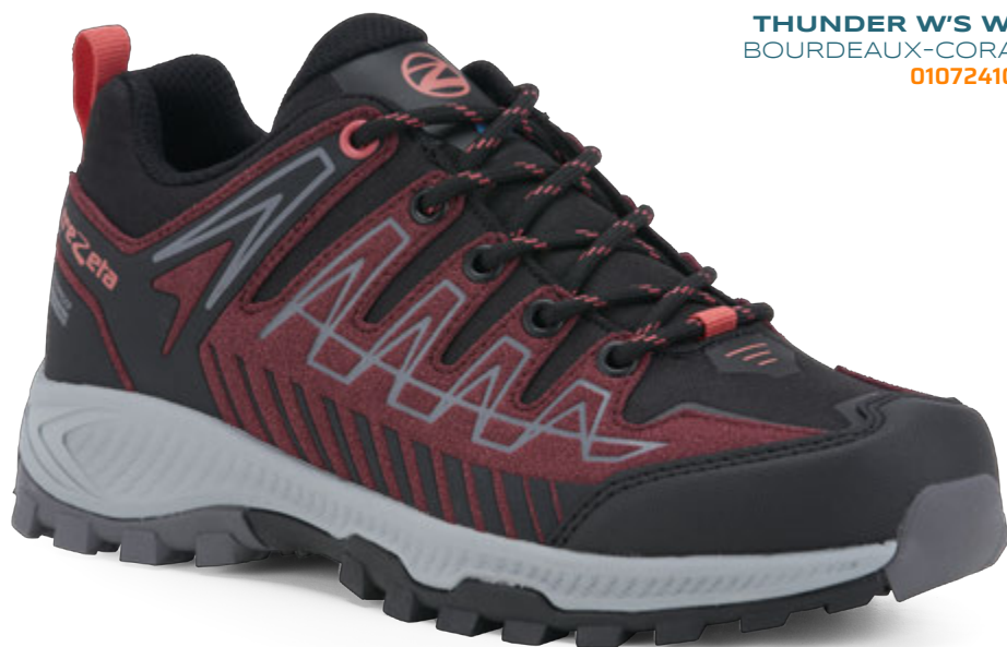
THUNDER W'S WP BOURDEAUX-CORAL 010724100