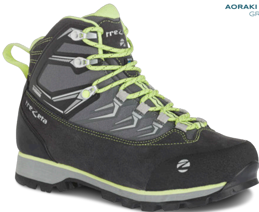
AORAKI W'S WP GREY-LIME 010722715