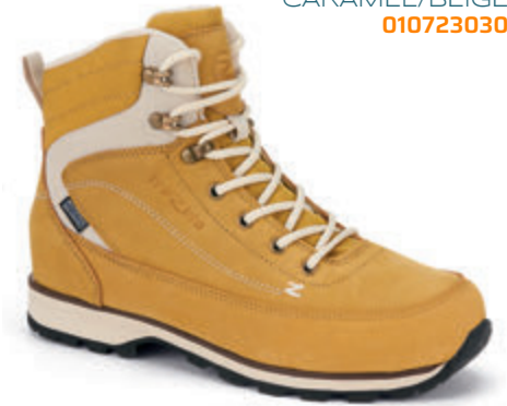
VELVET W'S WP CARMEL/BEIGE 010723030