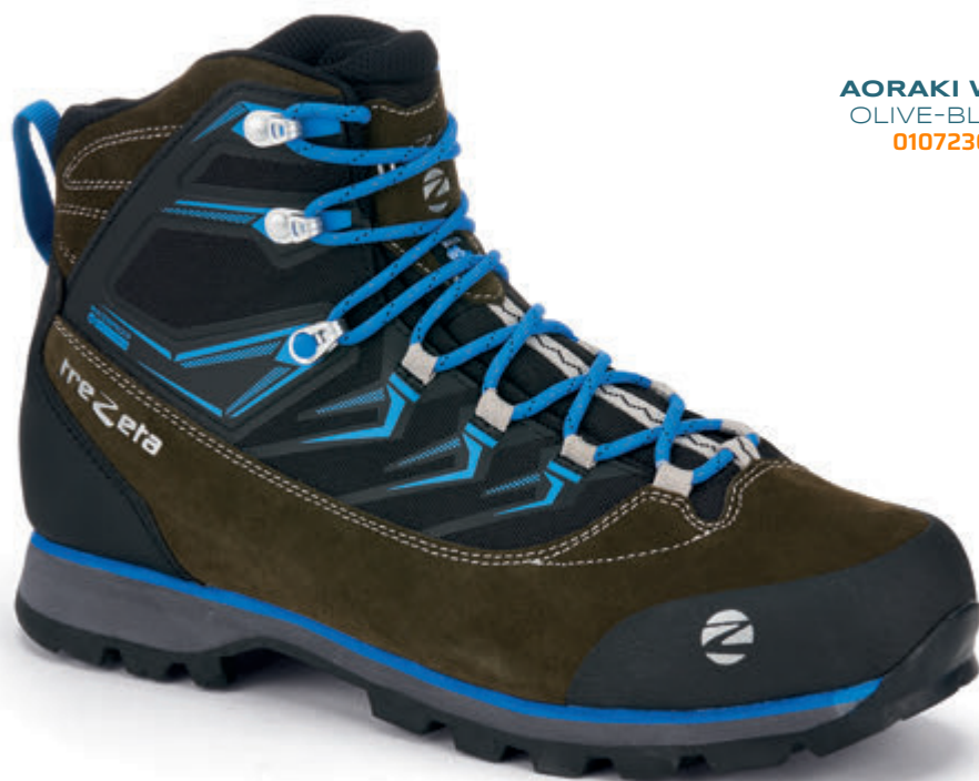
AORAKI WP OLIVE-BLUE 010723045

Aoraki WP è uno scarponcino da trekking dal taglio medio adatto a tutti e a ogni utilizzo, perfetto sia per una passeggiata rilassante nella natura sia per testarsi su sentieri di media difficoltà.