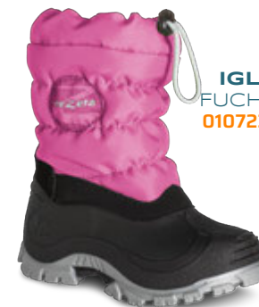
IGLOO FUCHSIA 010723135