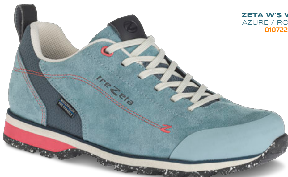
ZETA W'S WP AZURE / ROSE 010722615