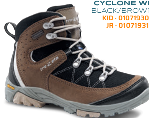
CYCLONE WP BLACK/BROWN KID · 010719309 JR · 010719310