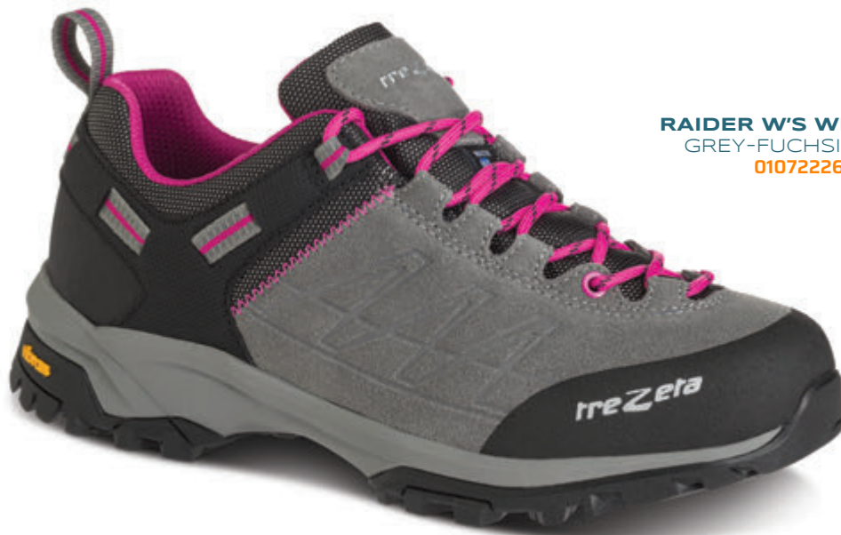
RAIDER W'S WP GREY-FUCHSIA 010722265