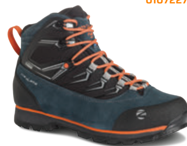
AORAKI WP BLUE INK-ORANGE 010722705