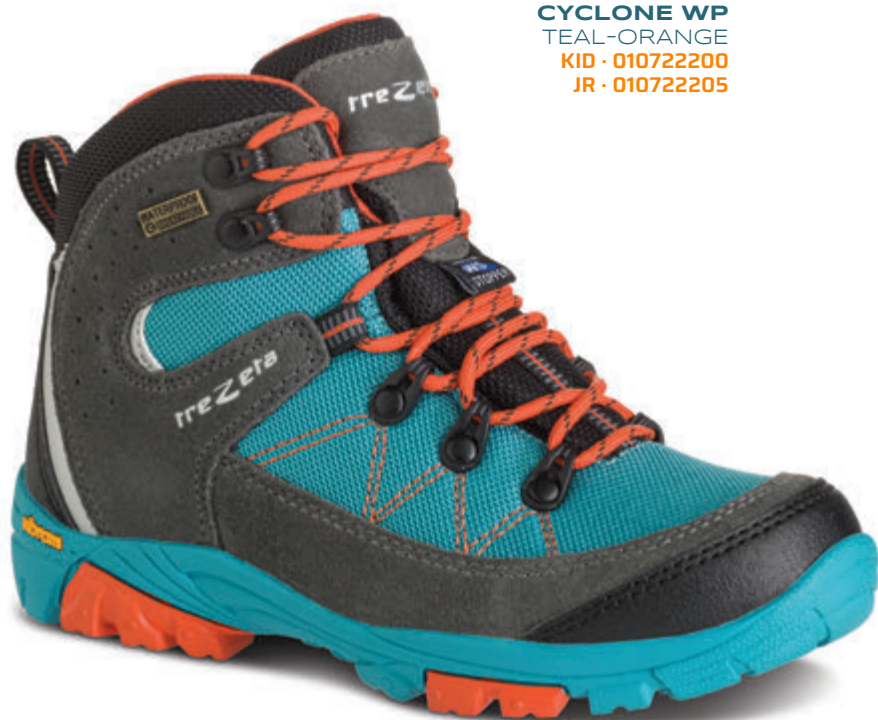
CYCLONE WP TEAL-ORANGE KID · 010722200 JR · 010722205

IT/ Scarponcino da escursionismo progettato secondo i criteri anatomici del piede del bambino. Grande comfort e versatilità per questo modello di scarponcino adatto all'attività del bambino in mezzo alla natura.