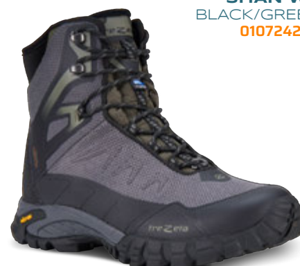
SHAN WP BLACK/GREEN 010724200