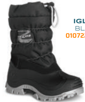
IGLOO BLACK 010722540