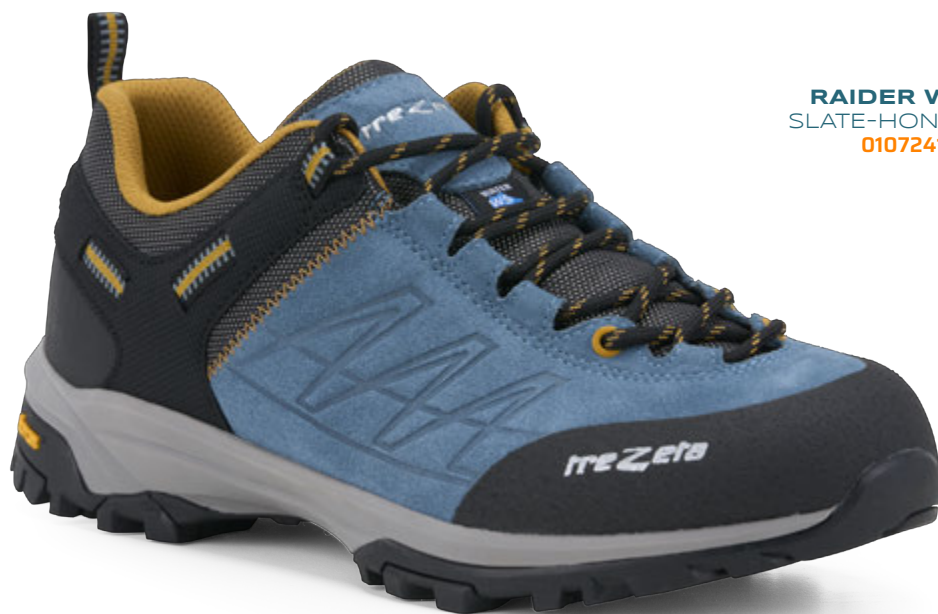
RAIDER WP SLATE-HONEY 010724170

IT/ Raider WP è una scarpa bassa per uso quotidiano, ideale per unire outdoor e lifestyle grazie alla caviglia libera e al suo look accattivante.