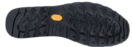
Vibram® Predator II