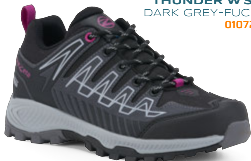
THUNDER W'S WP DARK GREY-FUCHSIA 010724105