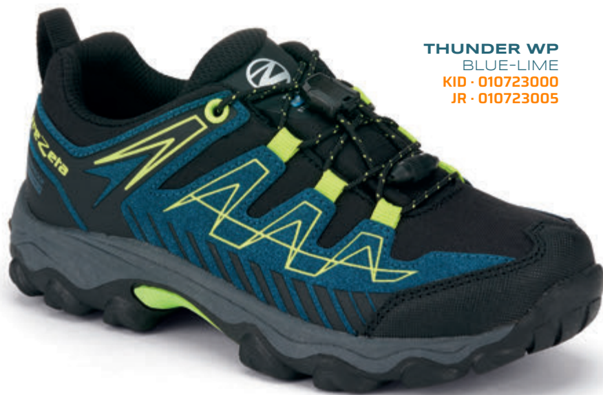
THUNDER WP BLUE-LIME KID · 010723000 JR · 010723005