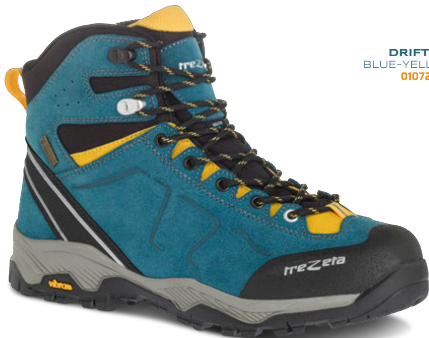
DRIFT WP BLUE-YELLOW 010722237

IT/ Drift WP è uno scarponcino da trekking comodo e sicuro dal taglio classico, perfetto per una piacevole uscita nei boschi o per camminare sicuri sui sentieri di montagna.