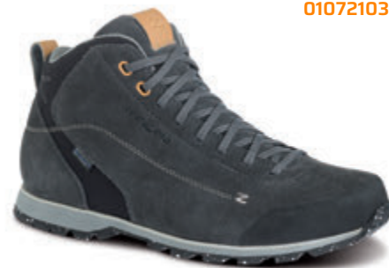
ZETA MID WP DARK GREY 010721030