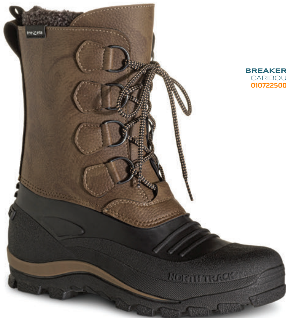
BREAKER CARIBOU 010722500

IT/ Performance e praticità tra la neve. Breaker è un doposci da uomo performante e robusto, ottimo per intense camminate sulla neve o per un momento di relax dopo una ciaspolata.