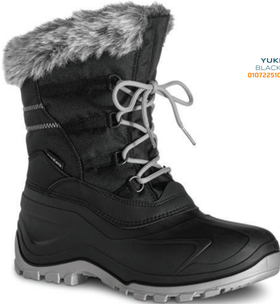
YUKI BLACK 010722510

Eleganza e comfort a bordo pista. Yuki è un doposci da donna comodo, elegante e caldo, l'ideale per godersi una giornata spensierata sulla neve o per un momento di relax dopo una sciata.