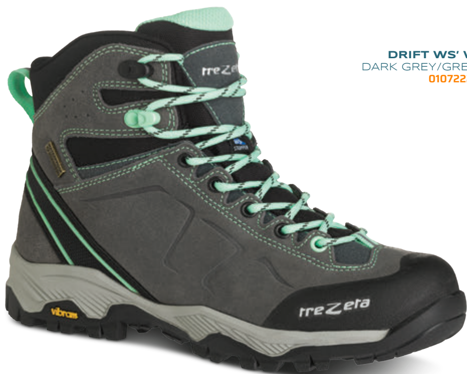
DRIFT WS' WP DARK GREY/GREEN 010722240