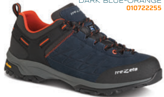
RAIDER WP DARK BLUE-ORANGE 010722255