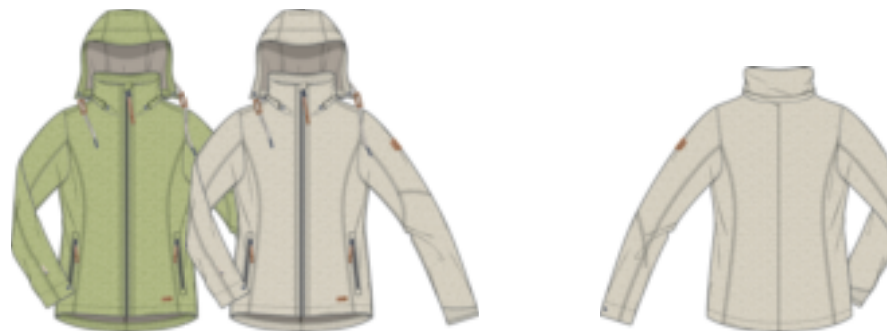
39504-00772 hell pistazie