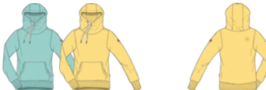
39432-00870 eisblau 39432-00655 hellgelb

39433 GS 120 WMN SWT SHRT CASUAL SWEATSHIRT MATERIAL Heavy Stretch Slub Jersey, 95% Baumwolle, 5% Elasthan EIGENSCHAFTEN carbon finish GRÖSSE 34 - 46