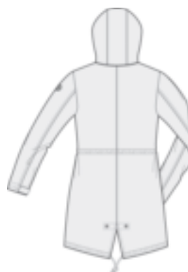
37955-00101 gebrochenes weiß