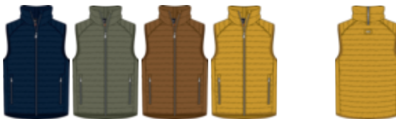
39345-00814 dunkelnavy 39345-00728 fading leafs 39345-00306 hellbraun 39345-00638 gebranntes gelb