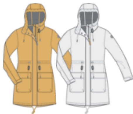
37955-00638 gebranntes gelb