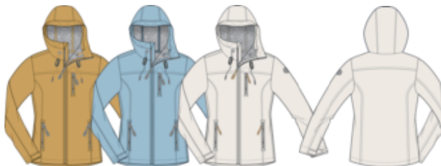
38392-00638 gebranntes gelb