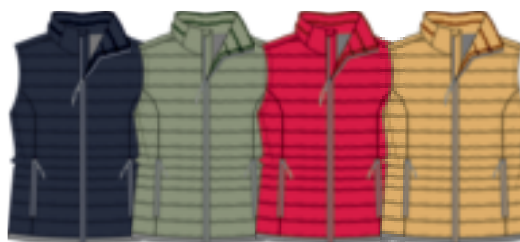
39529-00814 dunkelnavy 39529-00762 helloliv 39529-00402 modern red 39529-00638 gebranntes gelb