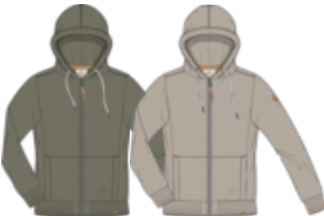
39500-00762 helloliv 39500-00331 hellsand