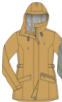
38391-00638 gebranntes gelb