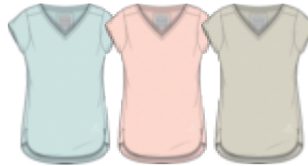
39350-00844 pale blue