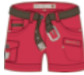
29023-00475 modern red