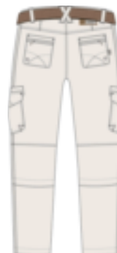
38388-00101 gebrochenes weiss