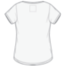
39349-00104 brilliant white