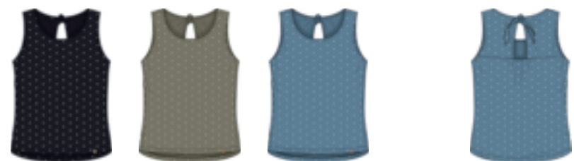
39422-00200 schwarz 39422-00762 helloliv 39422-00872 stahlblau

MATERIAL Cotton Single Jersey, 100% Baumwolle EIGENSCHAFTEN carbon finish GRÖSSE 34-46