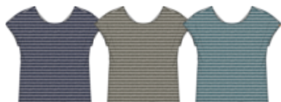
39426-00814 dunkelnavy 39426-00733 oliv 39426-00836 dunkelpetrol

MATERIAL Cotton Single Jersey, 100% Baumwolle EIGENSCHAFTEN carbon finish GRÖSSE 34 - 50