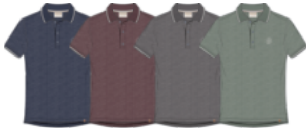
39445-00814 dunkelnavy 39445-00449 burgund 39445-00272 graphit 39445-00786 dunkelmint