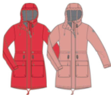
37955-00402 modern red