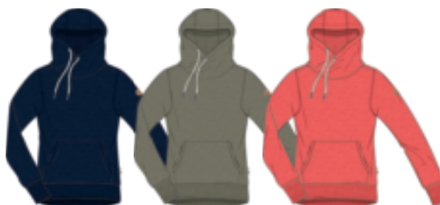
39432-00814 dunkelnavy 39432-00762 helloliv 39432-00466 dunkelkoralle

39432 GS 119 WMN SWT SHRT CASUAL KAPUZEN SWEATSHIRT MATERIAL Baby Terry, 100% Baumwolle EIGENSCHAFTEN carbon finish GRÖSSE 34 - 46