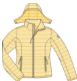
34313-00602 light sun