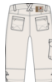
39528-00101 gebrochenes weiss