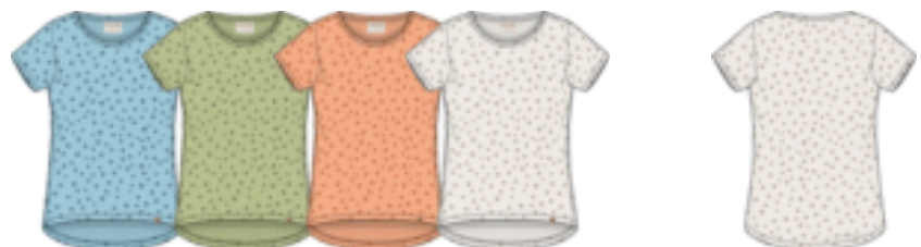
39423-00806 hellblau 39423-00772 hell pistazie 39423-00476 hellapricot 39423-00101 gebrochenes weiss

MATERIAL Cotton Single Jersey, 100% Baumwolle EIGENSCHAFTEN carbon finish GRÖSSE 34-50