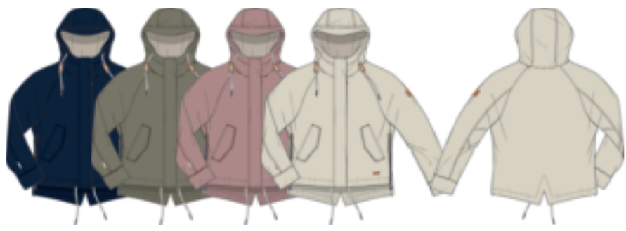
39416-00814 dunkelnavy 39416-00762 helloliv 39416-00271 taupe 39416-00106 champagner