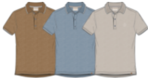
39445-00306 hellbraun 39445-00872 stahlblau 39445-00331 hellsand