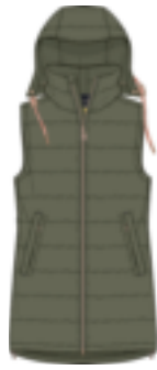
39341-00728 fading leafs