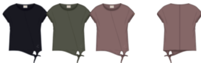
39428-00200 schwarz 39428-00733 oliv 39428-00523 malve

MATERIAL Cotton Single Jersey, 100% Baumwolle EIGENSCHAFTEN carbon finish GRÖSSE 34 - 46