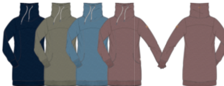
39433-00814 dunkelnavy 39433-00762 helloliv 39433-00872 stahlblau 39433-00523 malve

39433 GS 120 WMN SWT SHRT CASUAL SWEATSHIRT MATERIAL Heavy Stretch Slub Jersey, 95% Baumwolle, 5% Elasthan EIGENSCHAFTEN carbon finish GRÖSSE 34 - 46