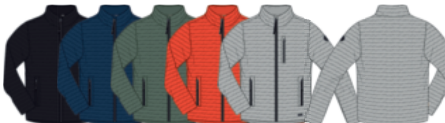
39434-00200 schwarz 39434-00786 dunkelmint 39434-00212 hellgrau 39434-00811 dunkelblau 39434-00432 feuerrot