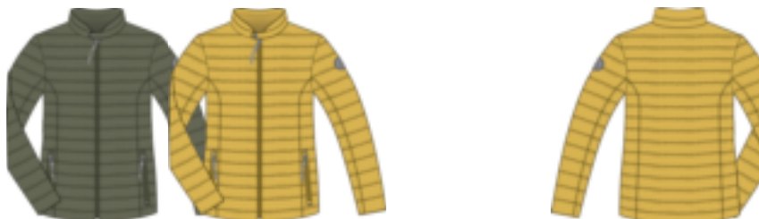
39005-00733 oliv 39005-00608 senfgelb