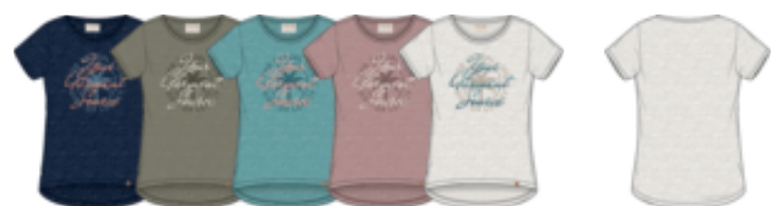
39424-00814 dunkelnavy 39424-00762 helloliv 39424-00744 hellpetrol 39424-00271 taupe 39424-00101 gebrochenes weiss

MATERIAL Cotton Single Jersey, 100% Baumwolle EIGENSCHAFTEN carbon finish GRÖSSE 34-50