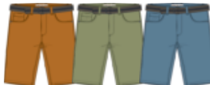
39441-00253 dark curry