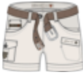
29023-00101 gebrochenes weiss