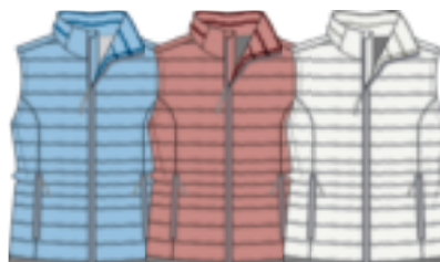
39529-00806 hellblau 39529-00425 rose 39529-00101 gebrochenes weiss