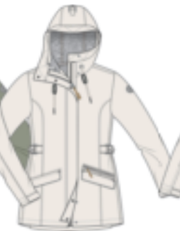
38391-00101 gebrochenes weiss