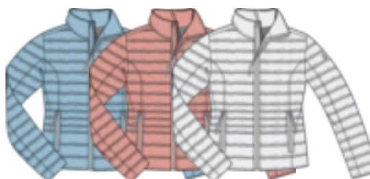
38346-00806 hellblau 38346-00425 rose 38346-00101 gebrochenes weiss