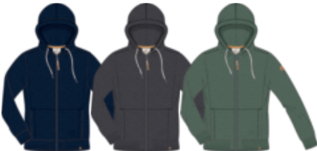
39500-00814 dunkelnavy 39500-00272 graphit 39500-00786 dunkelmint

MATERIAL Cotton Piquée, 100% Baumwolle EIGENSCHAFTEN carbon finish GRÖSSE S - 4XL