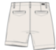
39419-00101 gebrochenes weiss