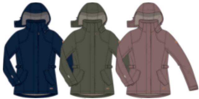
39417-00814 dunkelnavy 39417-00733 oliv 39417-00523 malve