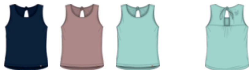
39459-00814 dunkelnavy 39459-00271 taupe 39459-00870 eisblau

MATERIAL Cotton Single Jersey, 100% Baumwolle EIGENSCHAFTEN carbon finish GRÖSSE 34-46