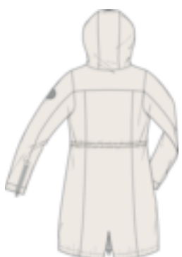
38050-00101 gebrochenes weiss