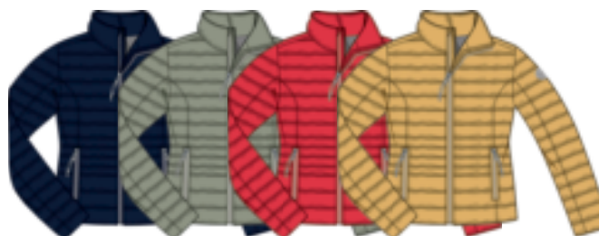
38346-00344 dunkelnavy 38346-00762 helloliv 38346-00402 modern red 38346-00638 gebranntes gelb