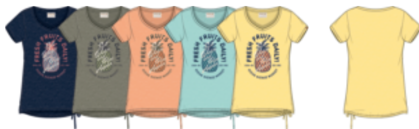
39425-00814 dunkelnavy 39425-00762 helloliv 39425-00476 hellapricot 39425-00870 eisblau 39425-00655 hellgelb