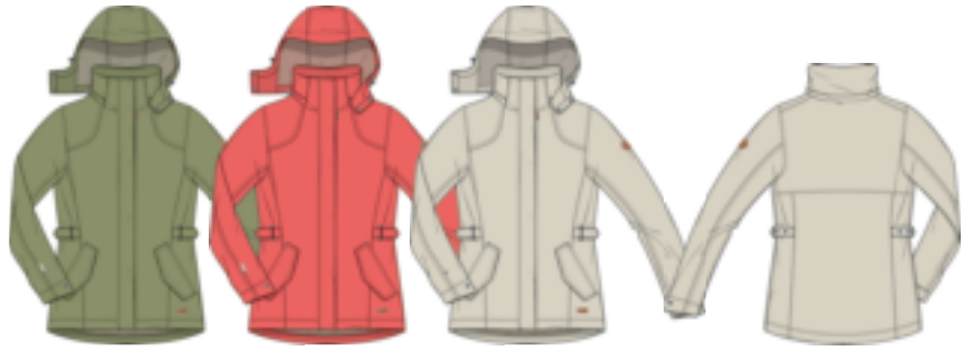
39417-00771 pistazie 39417-00466 dunkelkoralle 39417-00106 champagner