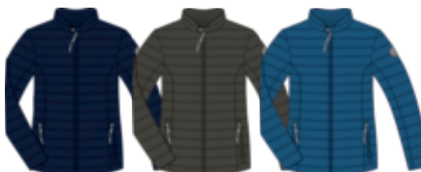
39005-00814 dunkelnavy 39005-00504 grünanthrazit 39005-00885 denim