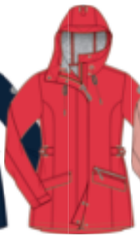
38391-00402 modern red