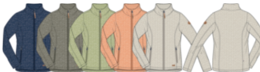
39493-00811 dunkelblau 39493-00762 helloliv 39493-00772 hell pistazie 39493-00476 hellapricot 39493-00106 champagner

39493 GS 138 WMN KNTFLC JCKT CASUAL STRICKFLEECEJACKE MATERIAL Jacquard Structure, 100% Polyester GRÖSSE 34 - 50