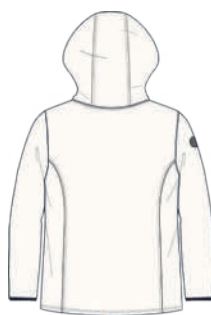
38098-00101 gebrochenes weiß